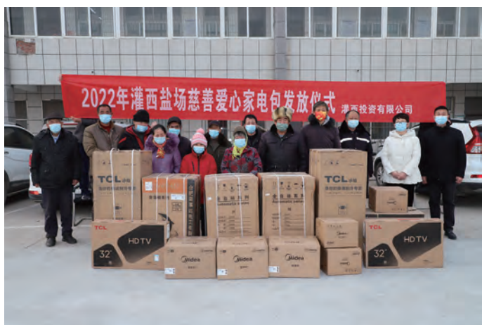
近日，灌西投资公司举行“2022 年灌西盐场慈善爱心家电包”发放仪式，20 户贫困家庭领到了价值近 2 万余元“爱心家电包”。此次慈善救助“家电包”是江苏省实施的民生项目，发放对象为有家电需求的城乡低保对象、分散供养特困人员、困难残疾人、困难职工、易返贫致贫人员等低收入家庭。(苏北)

锻造队伍，汇起磅礴力量。扎实开展“四亮工程”，结合发展实际设立“党员责任区”“党员示范岗”“党员先锋先行示范区”，广大党员在疫情防控、转型发展、创文创卫等大战大考中冲锋在前、勇挑重担。深化并启动“青投蓝领 3+”产改项目，聘授首席员工 6 名、行业技师 2 名、班组头雁 4 名，为广大产业工人创造一个“乐于奋斗、愿意成长”的发展平台。举办青蓝工程结对仪式，6 对班组长师徒依次签订师徒结对协议，充分发挥优秀骨干员工“传帮带”作用。(仲伟彬)