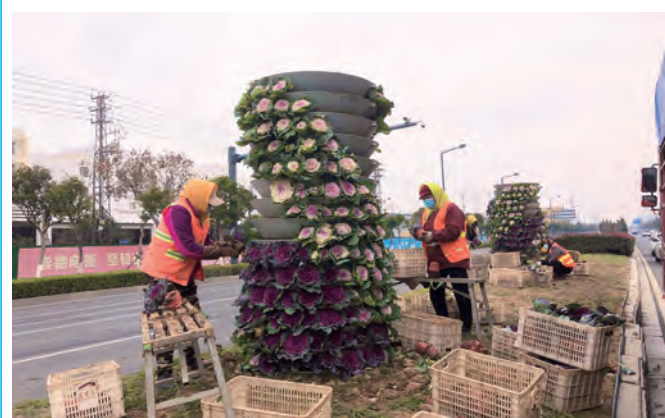
为进一步美化辖区环境,提升绿化景观品质,助力省生态园林城市创建验收。华茂益丰园林公司对东方大道、黄海大道等路口立体花柱进行草花更换,此次更换草花品种主体是近两万株羽衣甘蓝。(夏伟)

三组联建逐步完善。根据集团公司党委构建“三组联建”工作机制文件精神,台北公司召开“三组联建”工作推进会,各单位进一步完善“三组联建”工作机制,将“三组联建”与生产经营活动有机融合到一起,同时将“三组联建”纳入到单位年度考核中,以召开现场会的形式进行每月一考核,促进各单位之间相互学习好的经验做法,弥补工作中的不足,进一步深化“三组联建”的开展。(北工)