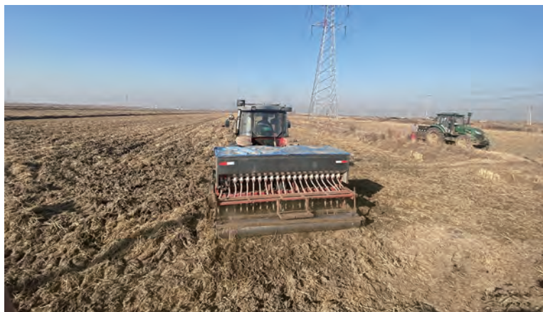
12月19日,青口投资公司大新农场700亩自营农田里机声隆隆,一台台机械正在播种小麦,一派繁忙景象,这也标志着农场稻麦两季种植模式正式拉开序幕。下一步,农场将加强田间管理,动态跟踪小麦生长情况,及时总结耐盐碱小麦种植技术和经验,为大面积耐盐碱小麦推广奠定基础。(王璐)

品牌效应提升产业链市场竞争力。全面推动“一企一品牌”创建。充分发挥劳模创新工作室示范引领,激发创新创效潜能,以党的二十大精神为指引,实施科技兴盐、科技强企,加强做好“品牌化+产业化”文章。高起点规划产业集群建设,充分发挥品牌对要素、资源的“吸附”作用,全力打造市场化经营管理体系。以品牌为价值链链接,以重点产业支撑为产业链链主,以经济效益联接机制为纽带,贯通产销,打造具有沿海特色的“开山岛”品牌纯天然绿色大米,打造具有淮盐文化底蕴的“开山岛”品牌系列功能性用盐,不断延展产业增值增效空间,提升产业比较优势和产品的市场竞争力,拓宽发展“钱”景。(许东彦)