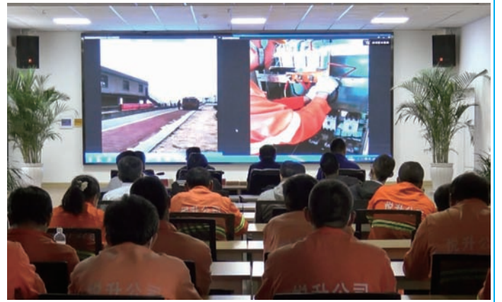
6月15日，徐圩投资公司按照“安全生产月”活动部署，在刘圩港闸站创新采取两台手机现场“直播”的形式，开展防汛应急供电救援安全演练活动。一台固定手机直播演练全景；一台流动手机对演练全程细节进行直播、讲解，观摩人员通过会议室大屏幕观看演练全过程。（陈健 侍作华）