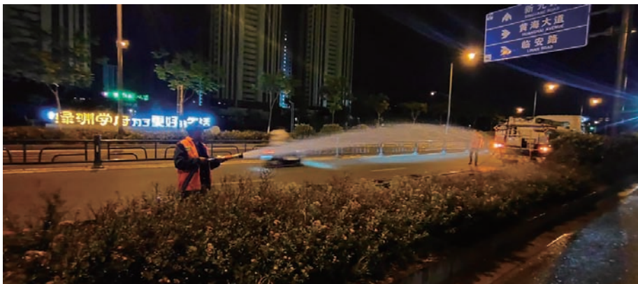
连日来，华茂绿化工程公司面对严峻的旱情，投入11辆洒水车，新铺设14公里绿化水路，购置3000余米地被喷灌水管，组织抗旱突击队员96名，采取错峰、错时、“白加黑”工作模式，确保自贸区400万平方米绿化苗木绿色“不掉色”。（张永静）

安全生产工作同抓共管。先后开展“隐患排查月、安全生产月”和节假日等各类安全检查活动11次，完成62条隐患整改，整改率100%，投入整改资金近30万元。先后开展安全培训7次，1200余人次得到安全教育。开展安全员和信息员“双聘双评”活动，推进落实“总经理与基层安全员咨询会”。早谋划、早预防、早准备做好防汛工作，签订防汛责任书300余份，强化领导带班、值班制度，确保安度雨季。（靳静）