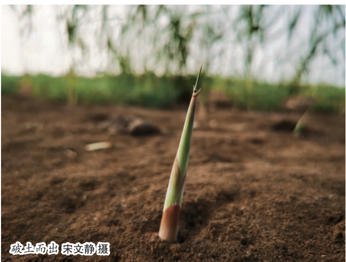
破土而出

这个夏季显得有些不同寻常，初晨的日常，中午的奔波，傍晚的坚守，这构成悦升人的夏季。在这个夏季，悦升人迎来新的五年合同，迎来成就梦想的机遇，迎来铸就辉煌的希望。这个夏季，悦升，走着、想着、捂着，也成长着。