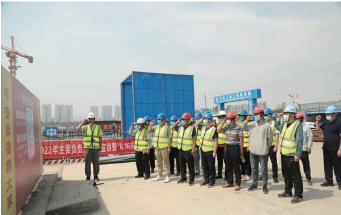
近日，房地产公司、神特新材料公司相继开展“6.16”安全咨询日活动，通过安全知识有奖问答、安全宣誓、宣传资料发放、观看安全宣传展板等活动，为安全生产筑牢防线。（徐宏亮 顾卫远 陈新）