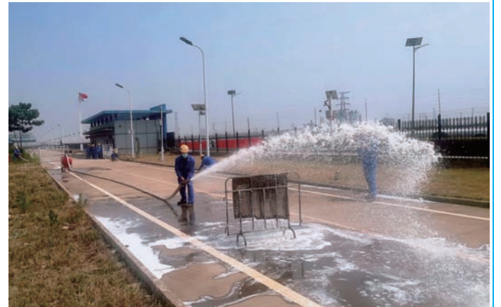
连日来，利海化工公司开展消防技能“大比武”，166名员工参加了正压式呼吸器、双人消防水带、泡沫灭火器、应急演练等比赛项目，进一步强化员工安全意识和安全操作技能水平。图为双人消防水带比赛现场。（王静静）