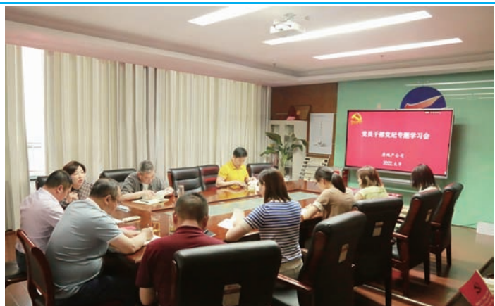
近日，房地产公司纪检开展“党员干部党纪专题学习会”活动，会上，由领导班子成员依次带头领读《中国共产党廉洁自律准则》《中国共产党纪律处分条例》，引领广大党员干部争做学党纪、守纪律的表率。(范苏亚)