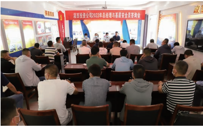
6月16日下午，灌西投资公司在新河制盐分公司召开“总经理与基层安全员咨询会”，来自基层各单位的安全员就职工劳保用品发放、用电线路老化、智能化改造、装卸设备等15个议题，向与会公司领导咨询，并现场给予解答，做出限时整改承诺，为灌西营造安全和谐的良好环境。（杨美娟）

通过一系列宣传活动的开展，进一步增强广大员工安全生产防范意识与自我保护能力，营造“人人关注安全、时刻注意安全、处处关心安全”的良好氛围，公司安全生产工作得到了进一步的强化。（姚瑶）