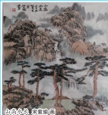
山高水长 宋紫瑜画

传说毕竟是传说，但沙光鱼“一年生、一年死”是个不争的事实。尤其是每年的十月，正是沙光鱼肥美的季节，民间素有“十月沙光赛羊汤”。